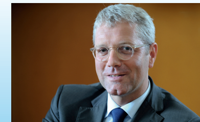
Bundesumweltminister Dr. Norbert Röttgen

„Ein effizienter und schonender Einsatz natürlicher Ressourcen ist eine der größten wirtschaftlichen, sozialen und ökologischen Herausforderungen unserer Zeit. Unsere Wirtschaft hat gute Voraussetzungen, zu einer der ressourceneffizientesten Volkswirtschaften zu werden. Mit der Kampagne ‚Wettbewerbsvorteil Ressourceneffizienz – Das zahlt sich aus‘ unterstützen wir gerade kleine und mittelständische Unternehmen dabei, das eigene Unternehmen fit für die Zukunft zu machen. Informieren Sie sich und nutzen Sie die vorhandenen Instrumente. Das stärkt nicht nur Ihr Unternehmen, sondern auch Deutschlands Wettbewerbsfähigkeit und sichert unsere Lebensgrundlage.“