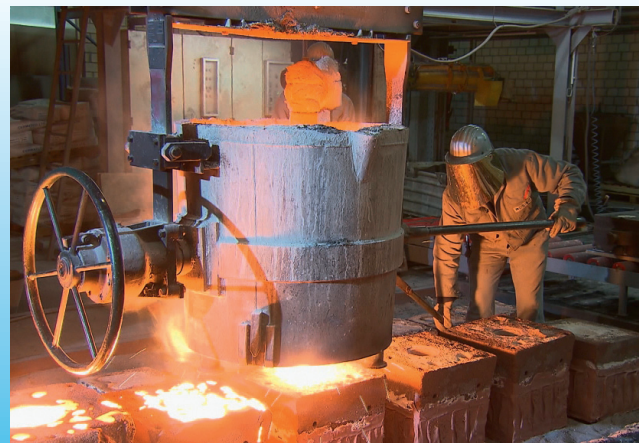
60 Prozent Gaseinsparung durch Porenbrenner

Die Gießerei setzt dabei auf die neue Technologie des Poren Brennens. Hierdurch ist die Energieübertragung absolut gleichmäßig und extrem effizient – und spart so mehr als die Hälfte des Gases ein, das bisher zur Aufwärmung der Gießpfannen eingesetzt wurde. Das schont nicht nur die Ressource Erdgas, sondern bedeutet für die Edelstahlwerke Schmees auch einen beträchtlichen Wettbewerbsvorteil.